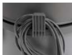
КРЮК ДЛЯ ШНУРА ЭЛЕКТРОПИТАНИЯ