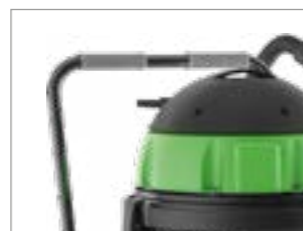
ТЕЛЕЖКА С РУКОЯТЬЮ